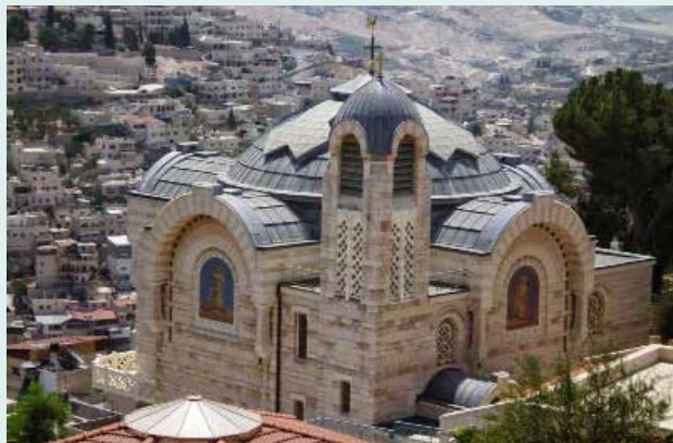
San Pietro in Gallicantus

Proseguimento dell'itinerario con il Monte Sion, per la visita del Cenacolo e della Tomba di David, l'Abbazia della Dormizione di Maria. Visita a San Pietro in Gallicantus e alla casa di Kaifa.