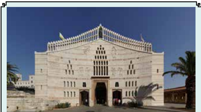
Basilica di NAZARETH

In serata incontro con la comunità greco-cattolica di Abuna Simean.