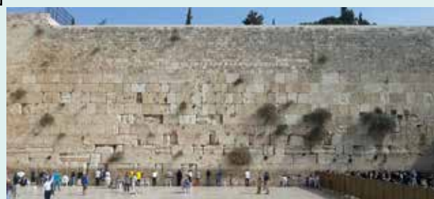
GERUSALEMME - Muro del Pianto

In mattinata ultimazione delle visite della Gerusalemme dentro le mura: la spianata delle Moschee, cioè di Omar (la cupola d'oro) e Al Aqsa (la cupola nera): entrambe NON sono visitabili all'interno. Proseguimento per il "Muro del Pianto", detto anche Muro Occidentale, la chiesa di Sant'Anna con celebrazione della S.Messa.